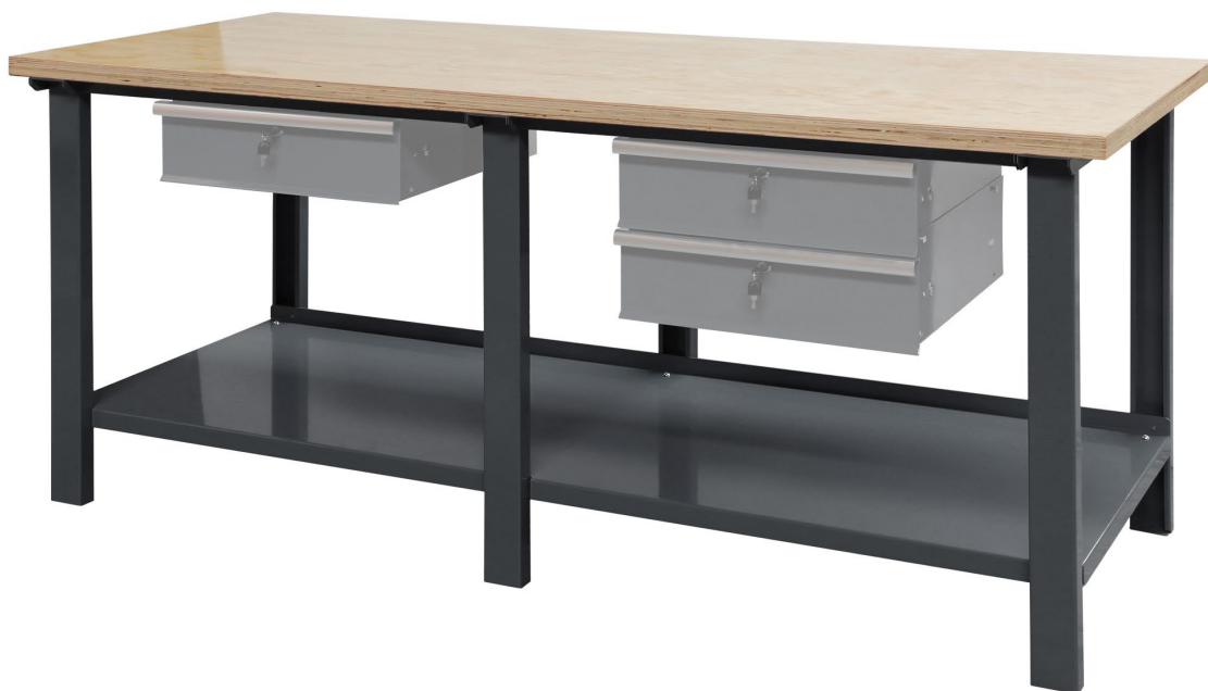
Avec tiroirs (accessoires en option)